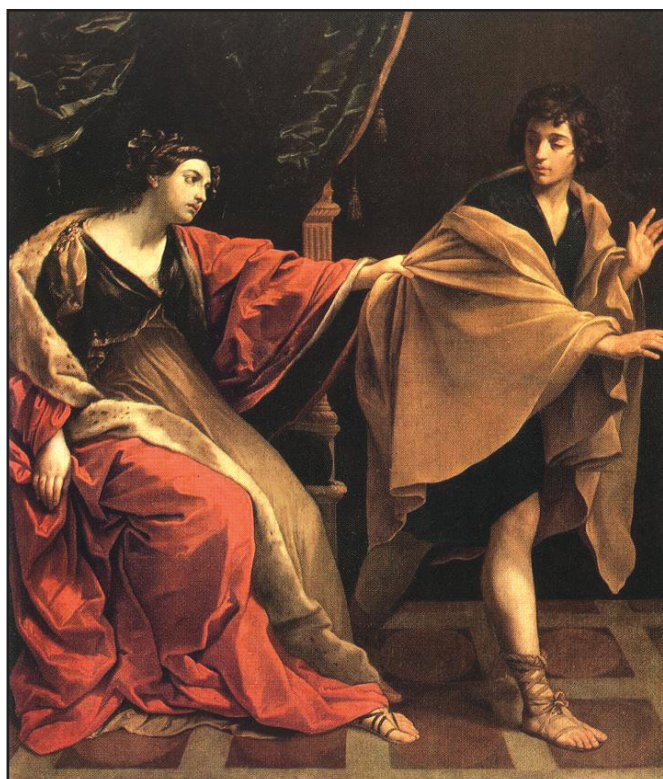
”יוסף ואשת פוטיפר”, גוויידו רני, איטליה, 1631