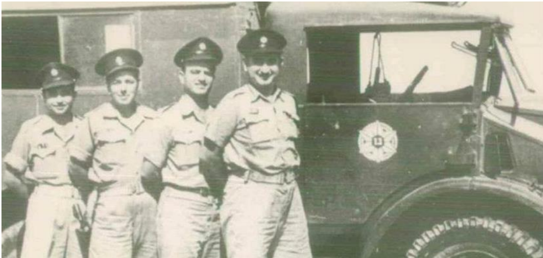
רכב משטרת ירושלים

בעיית המחסור בנשק עלתה מדבריו של מפקד משטרת ירושלים בהקשר של המאבק בארגוני האצ"ל והלח"י, מפקד משטרת ירושלים ציין, כי למשטרה אין את הנשק המתאים ואת הרכבים הנדרשים לביצוע התפקיד 415 .