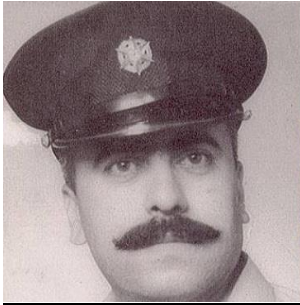
שוטר עם כובע שעליו סמל משטרת ישראל

מדי השוטרים נשארו כפי שהיו בתקופת המנדט וזאת מפאת המחסור בתקציב לרכישת מדים.