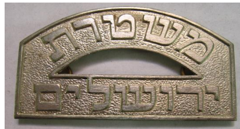
סמל משטרת ירושלים על כותפות המדים.

לשוטרים הונפקו תעודות מינוי משטרתיות עם המילה "שוטר" באנגלית ובערבית 193 .