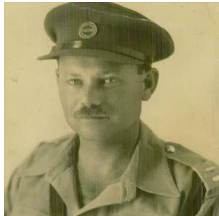
שוטר משטרת ירושלים עם כובע בריטי עם סמל משטרת ירושלים

"והקולפאק השנוא כל כך על השוטרים העבריים הוחלף עד מהרה בכובע השטוח שעד עכשיו חבשוהו רק האנגלים, ועבר זמן עד שיהודי ירושלים התרגלו לדעת שהשוטרים בכובעים אלה יהודים הם ולא אנגלים וכי אין צורך להוציא תעודות זהות..." 192 .