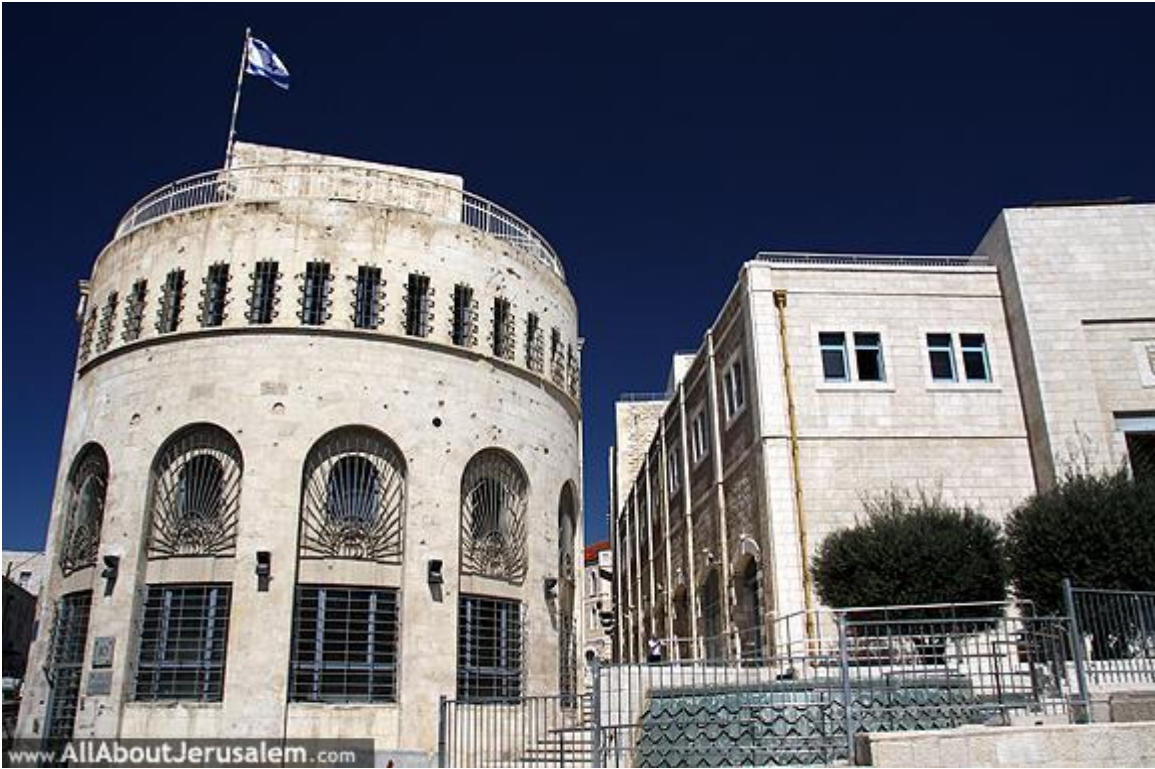
בניין עיריית ירושלים בירושלים בתקופת המנדט