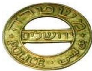
סמל משטרת ירושלים על כובע השוטרים